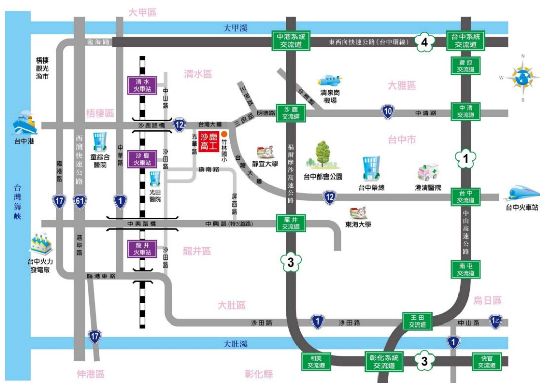
附圖一承辦學校（臺中市立沙鹿工業高級中等學校）位置圖